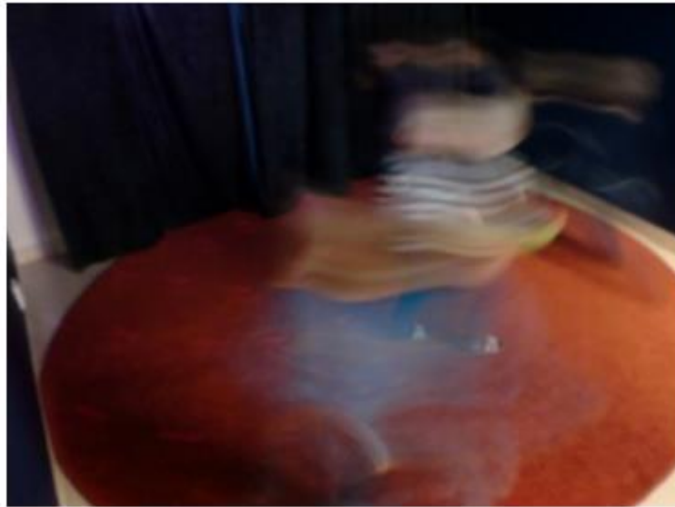
Figur 1. Digitalfoto

Jeg har valgt å bruke dette fotografiet som datamateriale. Inspirert av Barad (2007) undersøker jeg hvordan fotografiet kan tenkes som et fenomen, og tenker at det samtidig er et fenomen av improvisasjon i barnehagens prosjektarbeid.